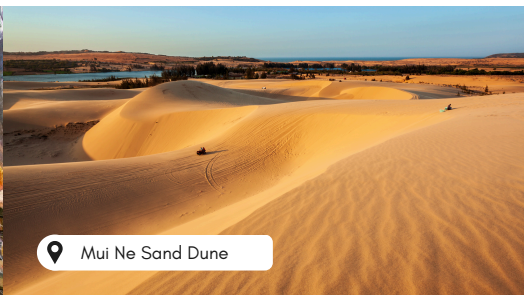
Mui Ne Sand Dune